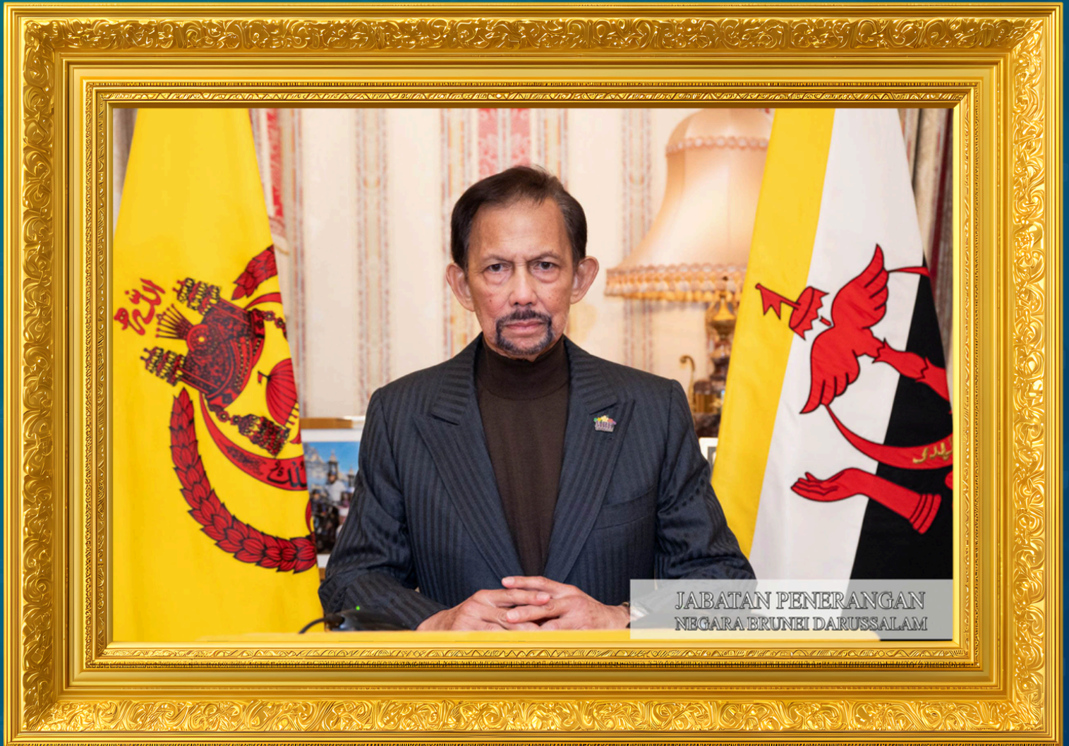
KEBAWAH DULI YANG MAHA MULIA PADUKA SERI BAGINDA SULTAN HAJI HASSANAL BOLKIAH MU'IZZADIN WADDAULAH IBNI AL-MARHUM SULTAN HAJI OMAR 'ALI SAIFUDDIN SA'ADUL KHAIRI WADDIN, SULTAN DAN YANG DI-PERTUAN NEGARA BRUNEI DARUSSALAM