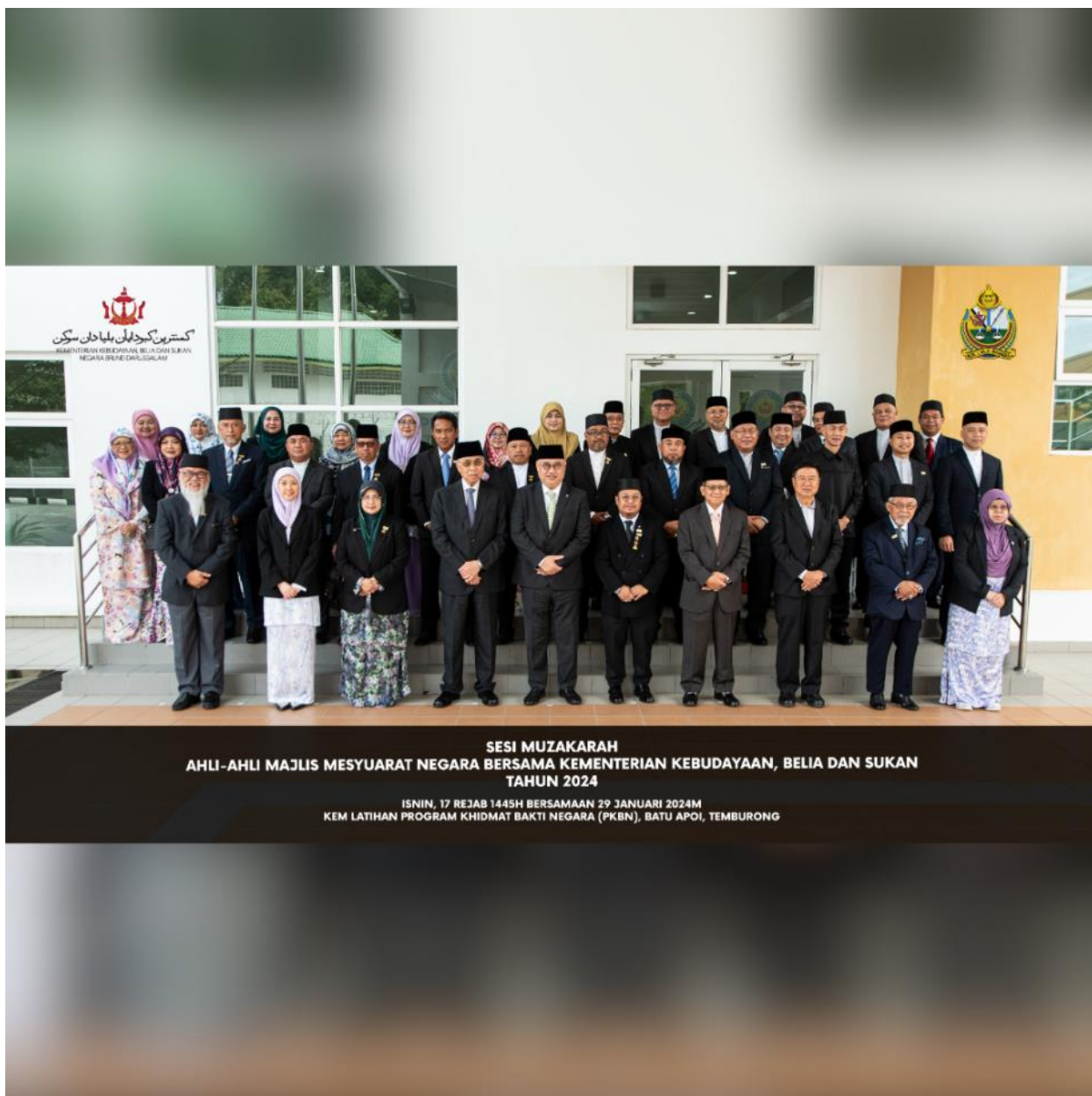
SESI MUZAKARAH AHLI-AHLI MAJLIS MESYUARAT NEGARA BERSAMA KEMENTERIAN KEBUDAYAAN, BELIA DAN SUKAN TAHUN 2024

ISNIN, 17 REJAB 1445H BERSAMAAN 29 JANUARI 2024M KEM LATIHAN PROGRAM KHIDMAT BAKTI NEGARA (PKBN), BATU APOI, TEMBURONG