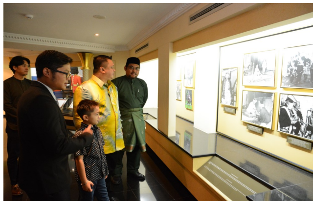
DYTM Tuanku Syed Faizuddin Putra Jamalullail dan Keluarga