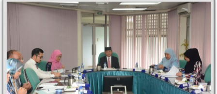
Unit Bencana Pulaie 24.01.2019