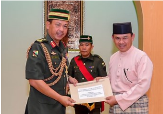
Surau Ad-Difa', Bolkiah Garison BERAKAS, Jumaat, 4 Januari