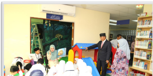
Perpustakaan Sengkurong 28.01.2019