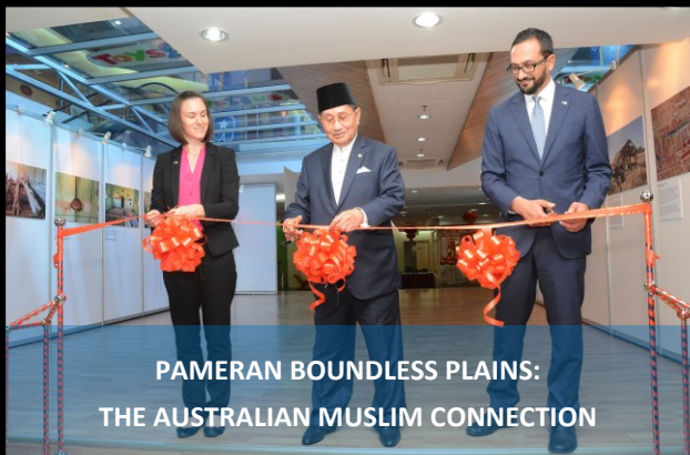
PAMERAN BOUNDLESS PLAINS: THE AUSTRALIAN MUSLIM CONNECTION