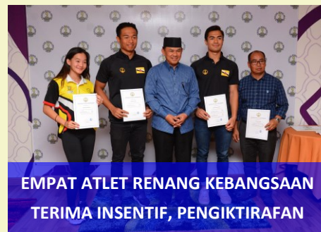
EMPAT ATLET RENANG KEBANGSAAN TERIMA INSENTIF, PENGIKTIRAFAN

Insentif tersebut diberikan oleh Persatuan Renang Amatir Brunei (BASA) kepada perenang kebangsaan yang mengambil bahagian dalam acara-acara yang disahkan oleh BASA dan FINA, di samping mematuhi peraturan dan peraturan FINA, juga sistem waktu elektronik yang tepat pada kekhidmatan tempatan atau antarabangsa.