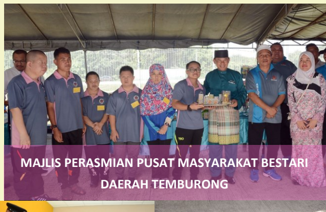
MAJLIS PERASMIAN PUSAT MASYARAKAT BESTARI DAERAH TEMBURONG