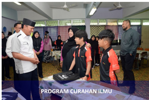
PROGRAM CURAHAN ILMU

Seramai 40 pelajar Tahun 6 yang bakal menduduki peperiksaan PSR tahun telah terpilih dari senarai 248 pelajar-pelajar (Sekolah Rendah Mentiri; SR Dato Mohd. Yassin; SR Sungai Besar; Sekolah Arab; SR Jalan 49 Lambak Kanan; SR Anggerek Desa dan SR Raja Isteri Fatimah) mengikuti tuisyen secara percuma bagi empat mata pelajaran iaitu Bahasa Melayu, Matematik, Sains dan English.