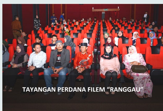
TAYANGAN PERDANA FILEM "RANGGAU"

menubuhkan Pusat Kegiatan Warga Emas (PKWE) yang dikenali sebagai Pusat Masyarakat Bestari (PMB) Temburong. Pusat ini akan menjadi 'One Stop Centre' untuk warga emas dan belia serta masyarakat sekeliling menjalankan kegiatan sosial yang berkebakikan ke arah masyarakat yang bersepadu dan berpengetahuan. Pusat ini juga ditubuhkan sebagai salah satu platform bagi warga emas untuk berinteraksi dan merapatkan jurang bersama pelbagai golongan masyarakat terutama sekali para belia, remaja dan kanak-kanak.