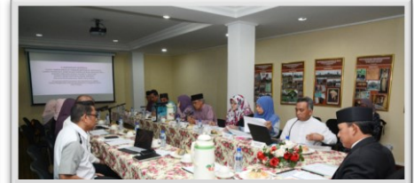
Pan Borneo 24.01.2019