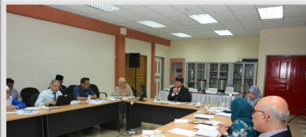
Kompleks Sukan Mumong 23.01.2019