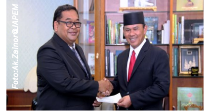
Pejabat Menteri KKBS, BERAKAS, Sabtu, 5 Januari