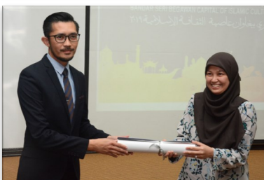
PENYERAHAN POSTER BANDAR SERI BEGAWAN BANDAR KETAMADUNAN ISLAM 2019