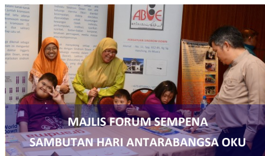
MAJLIS FORUM SEMPERNA SAMBUTAN HARI ANTARABANGSA OKU

Menteri Kebudayaan Belia dan Sukan semasa Majlis Perasmian Forum Sempena Sambutan Hari Antarabangsa OKU 2019.