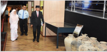
Muzium Teknologi Melayu 22.01.2019