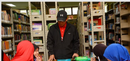
Perpustakaan Temburong 27.01.2019