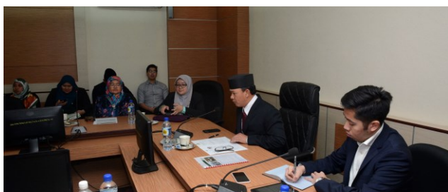
MESYUARAT AGUNG TAHUNAN KE-5, SCOT DAN MAJLIS PENGANUGERAHAN SCOT HONORARY AWARD

Setakat ini jumlah OKU yang berdaftar adalah 6506 orang - ( sumber statistik Jabatan Pembangunan Masyarakat ).