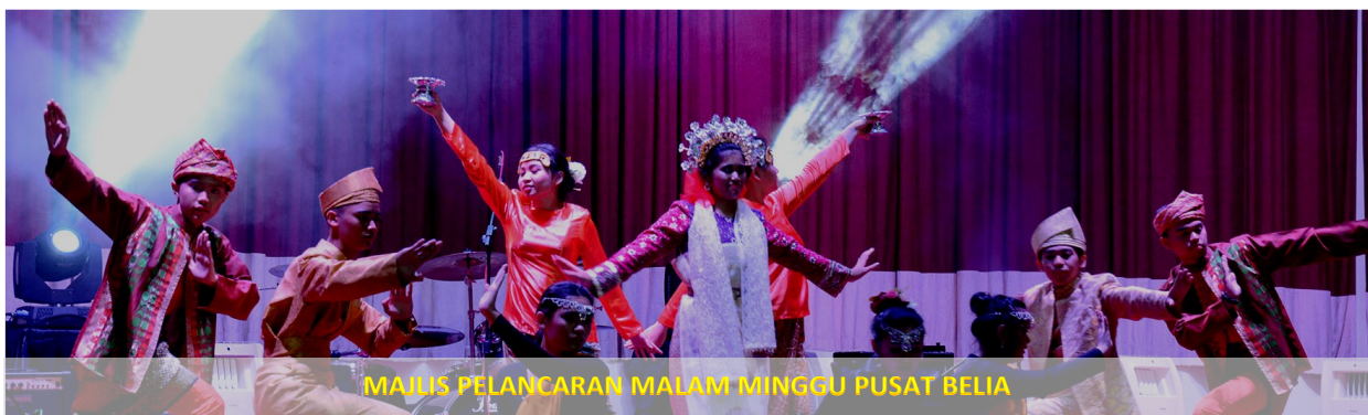
MAJLIS PELANCARAN MALAM MINGGU PUSAT BELIA

PUSAT BELIA, BANDAR SERI BEGAWAN, Sabtu, 5 Januari - "Sememangnya, dalam menerokai industri kreatif, apa yang turut penting ialah bagi para belia kita untuk sentiasa bersatu padu dalam memanfaatkan kolaborasi antara satu sama lain. Dalam usaha bersama ini, Kementerian Kebudayaan, Belia dan Sukan akan turut memberikan sokongan kuat kepada Industri Kreatif belia kita yang merangkumi pelbagai bidang," Yang Berhormat Menteri Kebudayaan Belia dan Sukan.