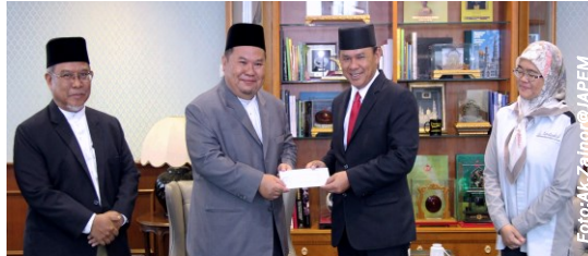
Pejabat Menteri KKBS, BERAKAS, Sabtu, 5 Januari