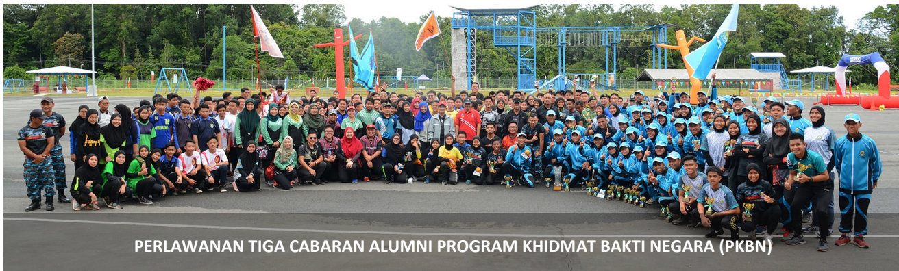
PERLAWANAN TIGA CABARAN ALUMNI PROGRAM KHIDMAT BAKTI NEGARA (PKBN)