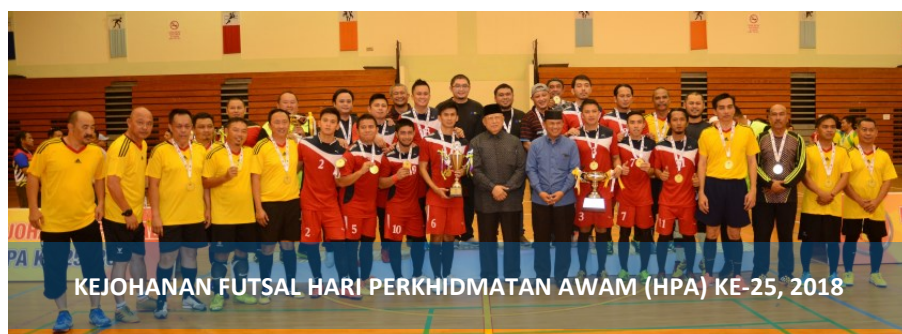
KEJOHANAN FUTSAL HARI PERKHIDMATAN AWAM (HPA) KE-25, 2018

Dewan Serbaguna Kompleks Sukan Negara Hassanal Bolkiah, Berakas, Ahad, 10 Februari - Kejohanan Futsal Hari Perkhidmatan Awam (HPA) Ke-25, 2018 anjuran bersama Jabatan Pentadbiran KHEU; Jabatan Daerah Brunei dan Muara (JDBM) dan Jabatan Belia dan Sukan serta Persatuan Bola Sepak Kebangsaan Brunei Darussalam (NFABD). Kejohanan yang bermula pada 3, 8 dan 10 Februari 2019 telah dibuka kepada 13 kementerian di Negara Brunei Darussalam dan sebanyak dua kategori dipertandingkan iaitu Kategori Terbuka (12 pasukan) dan Kategori Veteran (9 pasukan).