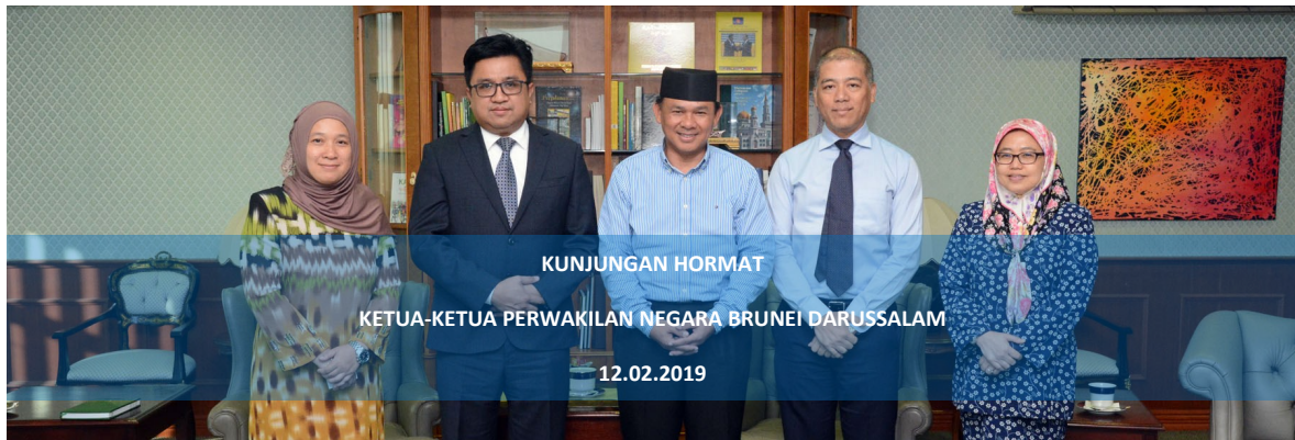
KUNJUNGAN HORMAT KETUA-KETUA PERWAKILAN NEGARA BRUNEI DARUSSALAM 12.02.2019