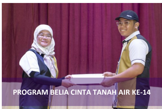
PROGRAM BELIA CINTA TANAH AIR KE-14

Sejurus selesai menunaikan solat berjemaah, acara diteruskan dengan YB Menteri Kebudayaan, Belia dan Sukan berserta rombongan beredar ke Perkampungan Sukan, Kompleks Sukan Negara Hassanal Bolkiah, Berakas bagi Upacara Menaikkan Bendera dan Menyanyikan Lagu Kebangsaan; Pembacaan Ikrar; Sorak PKBN; Nyanyian Lagu 'Sedia Berbakti'; bacaan doa; Latihan Jasmani diakhiri dengan sarapan pagi dan sesi ramah mesra dan motivasi YB Menteri KBS.