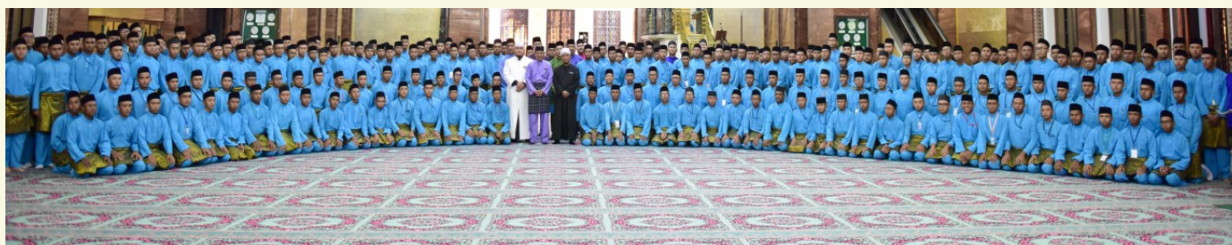
SOLAT SUBUH BERJEMAAH PELATIH PKBN PENGAMBILAN KE-LAPAN BERSAMA MENTERI KEBUDAYAAN, BELIA DAN SUKAN

MASJID OMAR ALI SAIFUDDIEN, BANDAR SERI BEGAWAN, Rabu, 20 Februari - Buat julung kalinya program tradisi Solat Subuh Berjemaah Pengambilan PKBN bersama Menteri Kebudayaan, Belia dan Sukan diadakan di Masjid Omar 'Ali Saifuddin, Bandar Seri Begawan.