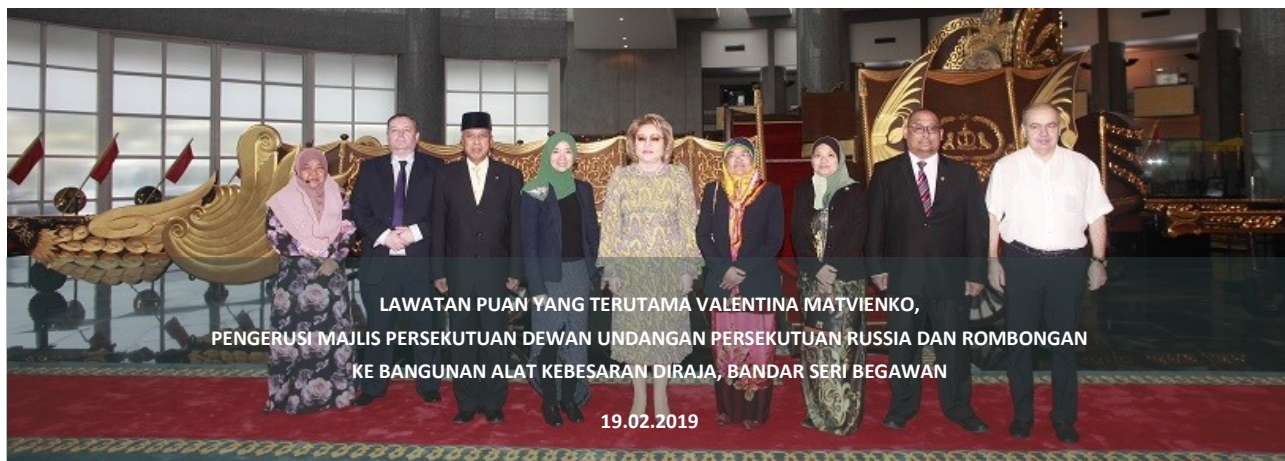
LAWATAN PUAN YANG TERUTAMA VALENTINA MATVIENKO, PENGURUSI MAJLIS PERSEKUTUAN DEWAN UNDANGAN PERSEKUTUAN RUSSIA DAN ROMBONGAN KE BANGUNAN ALAT KEBESARAN DIRAJA, BANDAR SERI BEGAWAN