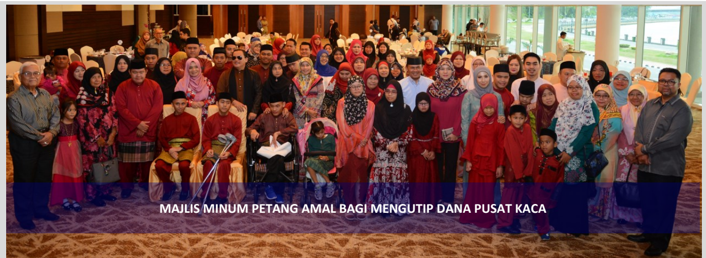
MAJLIS MINUM PETANG AMAL BAGI MENGUTIP DANA PUSAT KACA

MASJID SUFRI BOLKIAH, PERPINDAHAN BERAKAS Jumaat, 8 Februari – Menteri Kebudayaan, Belia dan Sukan, Yang Berhormat Mejar Jeneral (B) Dato Paduka Seri Haji Aminuddin Ihsan bin Pehin Orang Kaya Saiful Mulok Dato Seri Paduka Haji Abidin hadir selaku tetamu kehormat Majlis Pelancaran 73 Kali Khatam Al-Quran Warga Emas seluruh Negara Brunei Darussalam sempena Sambutan Ulang Tahun Hari Keputeraan Kebawah Duli Yang Maha Mulia Paduka Seri Baginda Sultan dan Yang Di-Pertuan Negara Brunei Darussalam Ke-73, Tahun 2019. yang disertai oleh lebih 300 warga emas yang yang terbahagi kepada 21 halaqah perempuan dan enam halaqah lelaki .