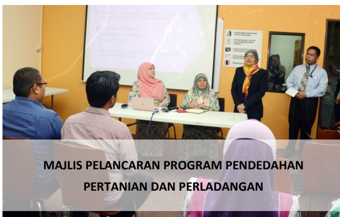
MAJLIS PELANCARAN PROGRAM PENDEDAHAN PERTANIAN DAN PERLADANGAN

PUSAT PEMBANGUNAN BELIA, TANAH JAMBU, Isnin, 18 Februari - Seramai 31 belia terpilih menyertai Program Pendedahan Pertanian dan Perlindungan (Peladang Muda) Kerjasama antara PPB dan Jabatan Pertanian dan Agrimakanan iaitu 30 orang dalam sektor sayur dan buah-buahan dan seorang dalam sektor padi. Para peserta akan menjalani Program Latihan Kemahiran bermula 18 hingga 27 Februari 2019 Program penempatan kerja akan bermula pada 11 Mac hingga 4 Jun 2019 akan dilaksanakan di syarikat-syarikat yang telah dikenal pasti berdasarkan pembahagian kluster Mukim dan Daerah Brunei Darussalam.