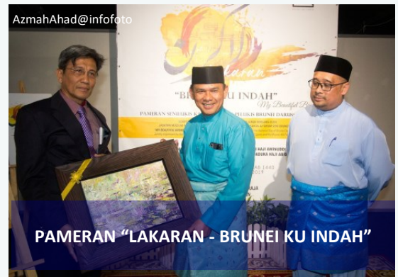
PAMERAN "LAKARAN - BRUNEI KU INDAH"

GALERI SENI, DERMAGA DIRAJA, BANDAR SERI BEGAWAN, Sabtu, 16 Februari - Sebanyak 123 buah lukisan hasil karya 54 pelukis-pelukis tempatan dipamerkan pada Pameran Seni Lukis "Lakaran – Bruneiku Indah" bersempena dengan Sambutan Hari Kebangsaan Negara Brunei Darussalam Ke-35 Tahun.