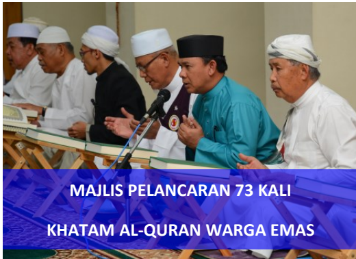
MAJLIS PELANCARAN 73 KALI