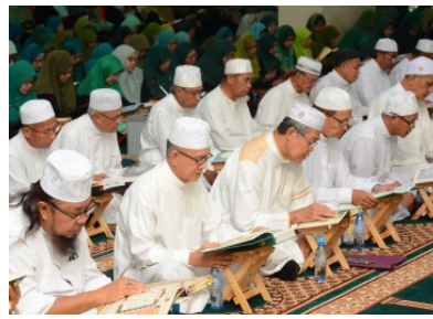
KHATAM AL-QURAN WARGA EMAS