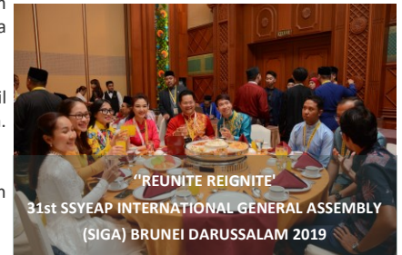
“REUNITE REIGNITE” 31st SSYEAP INTERNATIONAL GENERAL ASSEMBLY (SIGA) BRUNEI DARUSSALAM 2019

Negara Brunei Darussalam telah menjadi tuan rumah buat kali kedua bagi perhimpunan yang dijalankan selama tiga hari itu.