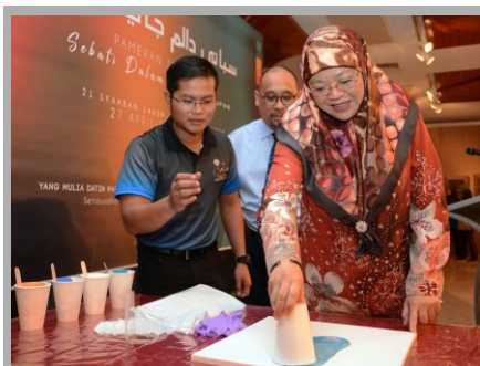
PAMERAN SENI LUKIS SEBATI DALAM JALINAN WARNA 2019

Muzium Teknologi Melayu, KOTA BATU, Sabtu, 27 April - Jabatan Muzium-Muzium dengan usaha bersama Muzium Artis (MuzArt) menganjurkan Pameran Seni Lukis Sehati dalam Jalinan Warna 2019 yang mempamerkan 85 buah karya seni daripada 38 pelukis Jabatan Muzium-Muzium yang terdiri daripada berlainan profesion dan bahagian.