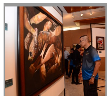
Dari bulan Januari hingga Mac tahun ini, Muzium Teknologi Melayu menerima kunjungan pelawat sejumlah 18,021.

Pameran sementara di Muzium Teknologi Melayu berkenaan adalah inisiatif pihak jabatan dalam menambah nilai pameran di muzium, selain daripada meningkatkan jumlah pelawat ke muzium-muzium di negara ini selaras dengan strategi KKBS melalui Jabatan Muzium-Muzium, iaitu menyediakan 'platform' dengan memberikan ruang-ruang yang tersedia dalam aset-aset bangunan jabatan yang bersesuaian untuk penggiat-penggiat seni menengahkan dan mempamerkan bakat-bakat mereka.